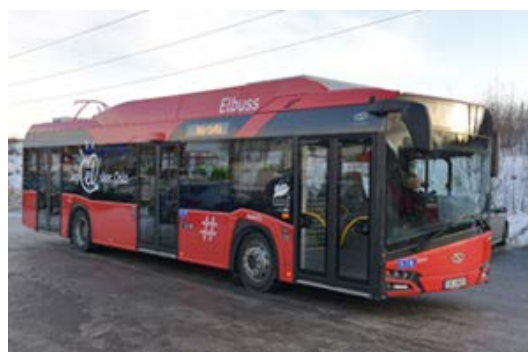
Nye El-busser i Oslo.