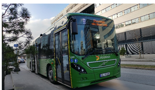
«Grønne busser» i Stavanger

Torghatten ASA er et av landets største transportkonsern med en årlig omsetning på ca.10 milliarder og ca. 7000 ansatte. Hovedvirksomheten er innenfor transport med ferje, hurtigbåt, buss og fly i hele Norge og vi transporterer 70 millioner passasjerer i året. Til dette disponerer konsernet en flåte på omtrent 100 fartøy, ca. 1570 busser og 44 fly.